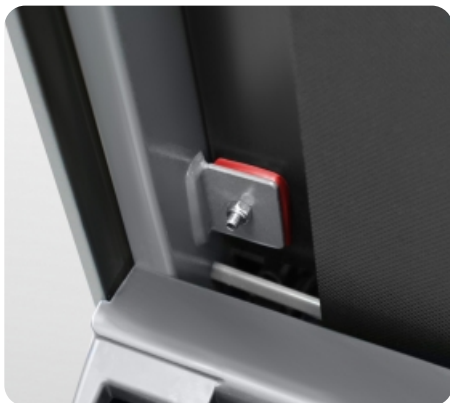
4 плоских эластомера Natural™