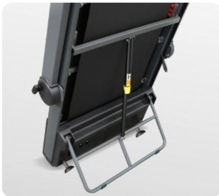
Гидравлическая система safeFOLD™