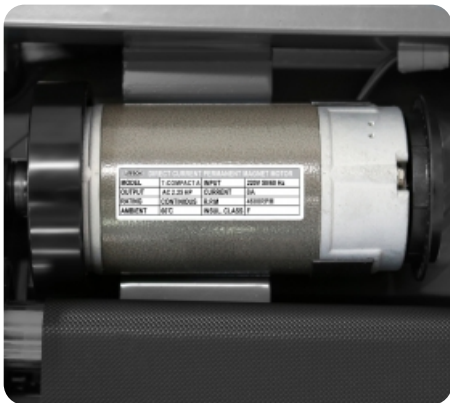
Двигатель от японского производителя Fuji Electric мощностью 2.25 л.с.