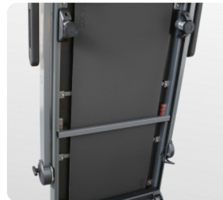
Комбинированная система амортизации