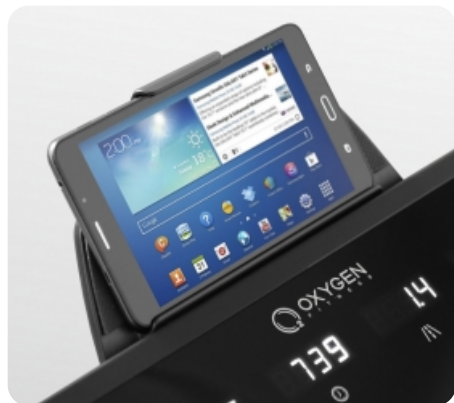
Подставка для гаджетов