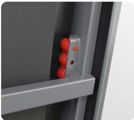
2 трехкомпонентных динамических эластомера 3-Fold Flanks™