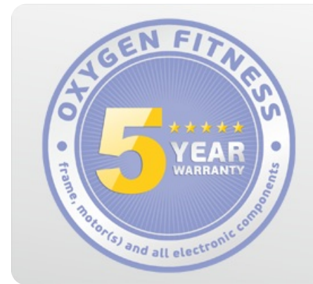
Честная 5-ти летняя гарантия на раму, мотор и все электронные компоненты