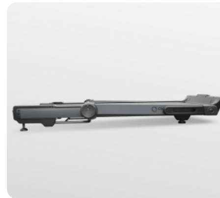
В сложенном виде толщина тренажера составляет 22 см. Моторный отсек находится на одном уровне с рамой деки и выглядит как единое целое