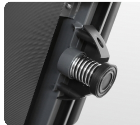
2 цилиндрических эластомера с пружинами Natural™ Springs