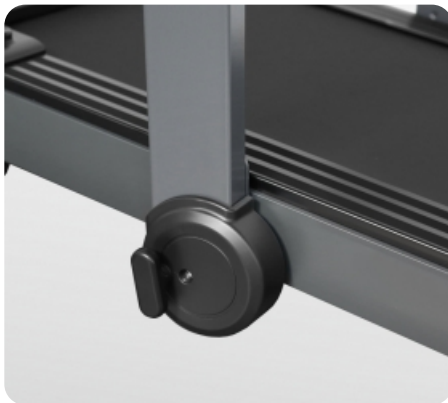
Уникальная система складывания