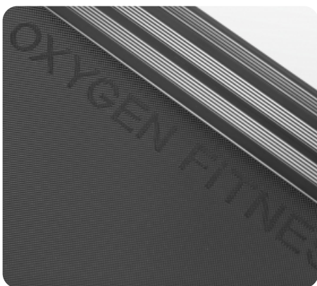
Многослойное полотно Habasit NVT-220 (толщина 2.0 мм)