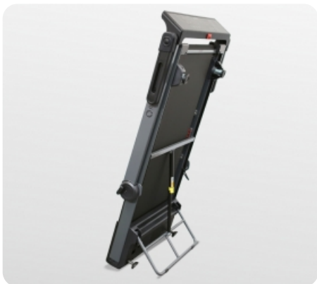
В сложенном виде вертикально