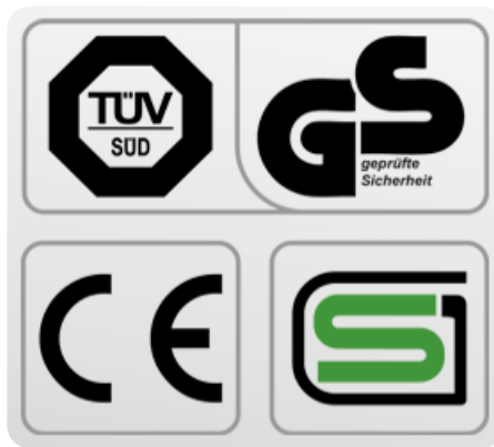
Обязательные сертификаты: европейский CE, немецкий GS TUV, японский SG