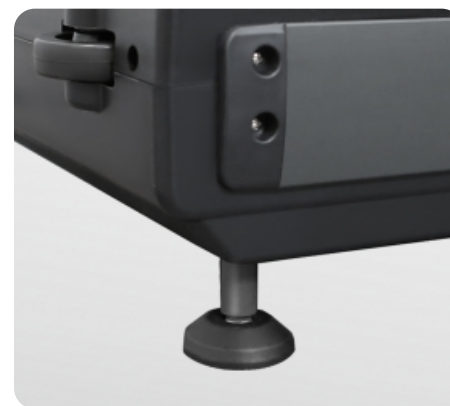
Передние ножки для устойчивого положения и транспортировочные ролики